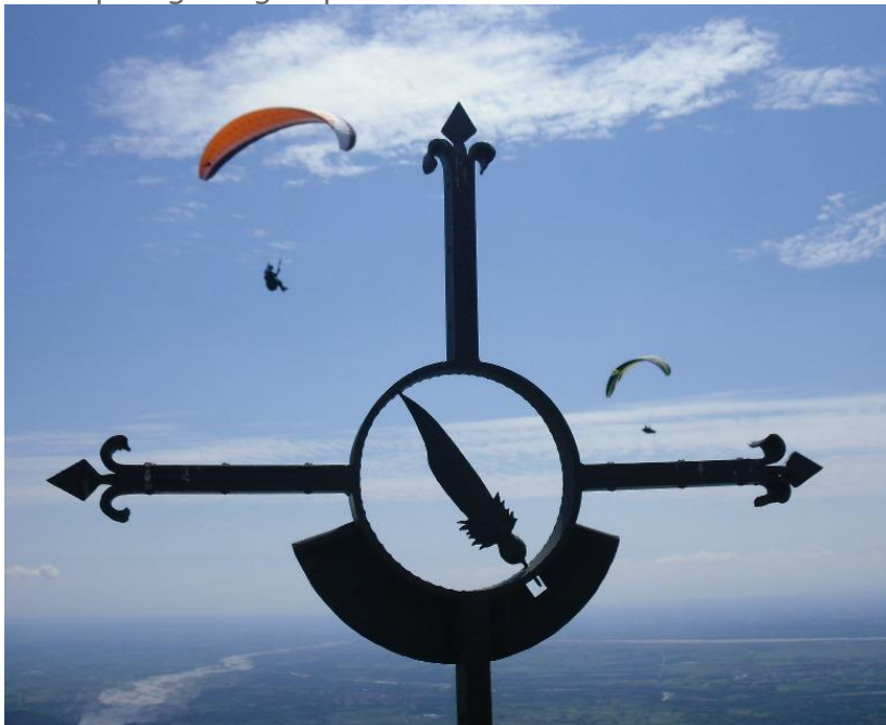
Foto vom Gipfelkreuz: Dies kennen nur diejenigen die brav hochgelaufen sind oder oben eingelandet sind!! Also beim nächsten Mal hoffentlich alle!