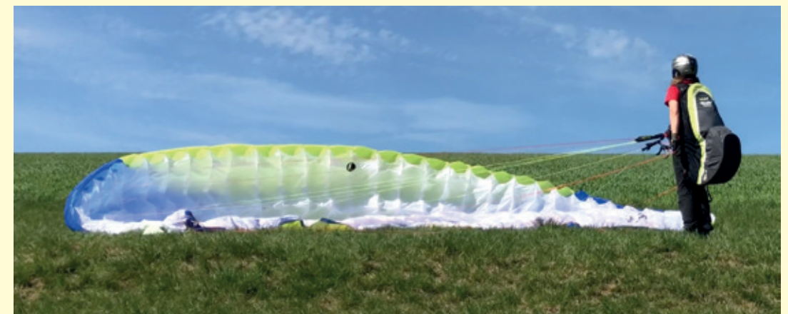
Abb. 11.18: Der Pilot greift beidseitig in die Steuerleinen, um den Schirm kontrolliert abzulegen. Durch einen Schritt auf die Kappe zu, kann er den Druck weiter minimieren.