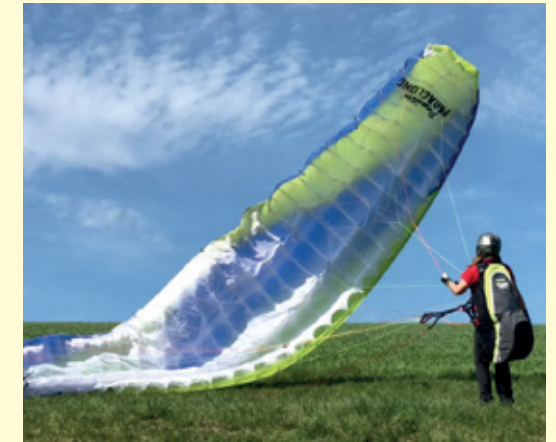
Abb. 11.16: Über einen dosierten einseitigen Steuerleinenzug, beginnt die Kappe einseitig zu steigen.