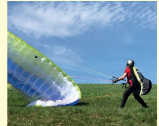
Abb. 11.17: Die Flügelseite steht senkrecht zum Boden. Der Pilot läuft nach links mit.